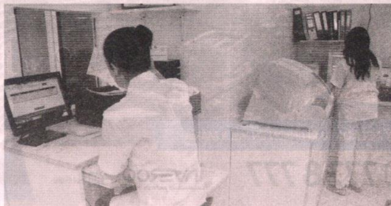
Diversidad de especialidades. Actualmente en el laboratorio trabajan cuatro profesionales de la salud, cada una con tareas específicas diferentes.