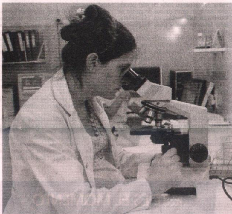
Números. El Laboratorio de la Mutual Maradona Salud por mes atiende alrededor de 650 afiliados y realiza aproximadamente 1.400 análisis.

"El proceso cuenta con auditorías internas. Por ejemplo, personal del área de Odontología evaluó nuestro trabajo", puntualizó la profesional.